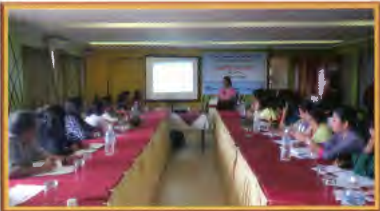
भुकम्प पश्चात मानव बेचबिखन विरुद्धको अन्तरक्रिया कार्यक्रम