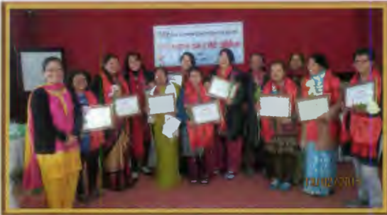
११ औं साधारण सभामा एटविनको नेतृत्व हस्तान्तरण गर्दै