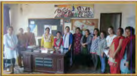
राष्ट्रिय महिला आयोगमा ज्ञापन पत्र हस्तान्तरण