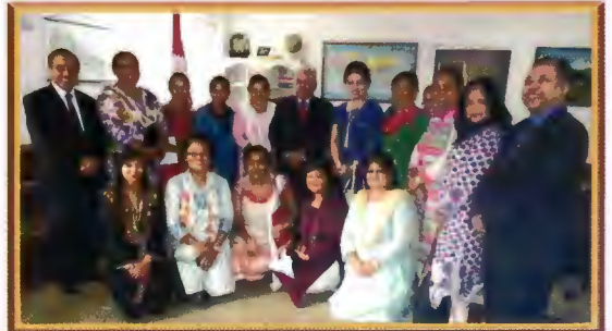
भुकम्प पश्चात महिलाको सवाल सम्बोधनका लागि माननीय परराष्ट्र मन्त्रि महेन्द्र पाण्डेलाई ज्ञापनपत्र बुभाउँदै