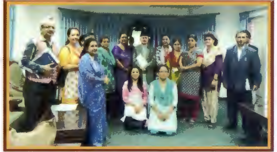
महिला मैत्री संविधानकालागि सभामुख लाई ज्ञापनपत्र बुभाउँदै