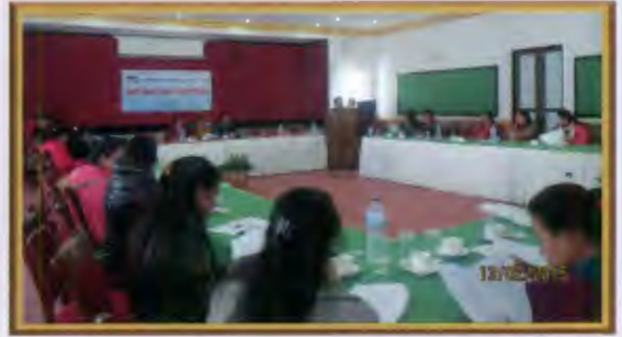
एटविनको रणनीतिक योजना कार्यशाला