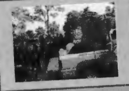
काभ्रेको देउपुरमा राहत वितरण