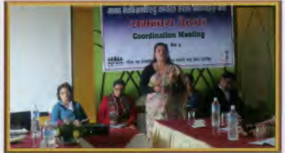
मानव बेचबिखन विरुद्धको समन्वय बैठक