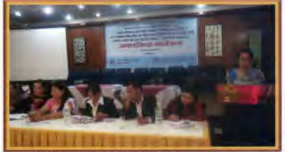
मानव बेचबिखन विरुद्धको UN Protocol अनुमोदन सम्बन्धि कार्यक्रम