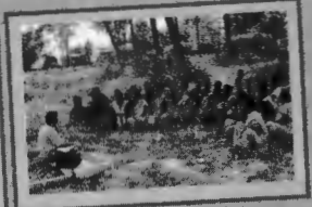
नवलपरासीमा जीविकोपार्जन र सशक्तिकरण विषयक छलफल