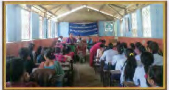
सिन्धुपाल्चोकमा सामुहिक मनोविमर्श सचेतना कार्यक्रम