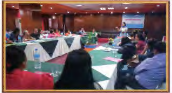
विनाशकारी भुकम्प पश्चातको बेचबिखन र यस विरुद्धको राष्ट्रिय कार्ययोजना