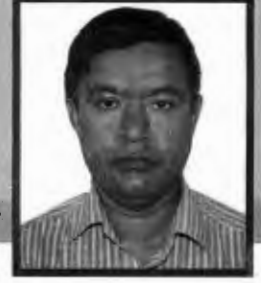
डा. पदमप्रसाद खतिवडा