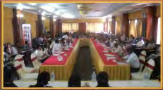
मानव बेचबिखन विरुद्धको UN Protocol अनुमोदन सम्बन्धि कार्यक्रम