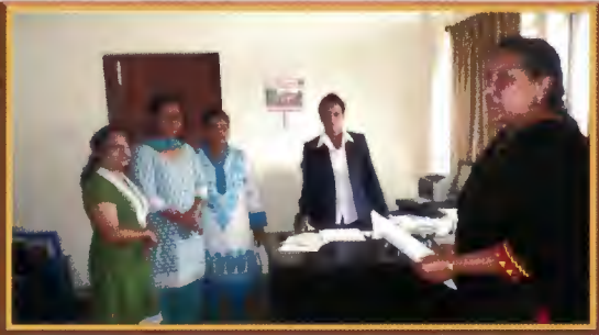
भुकम्प पश्चात बढेको मानव वेचबिखन नियन्त्रणका लागि महिला, बालबालिका तथा समाज कल्याण मन्त्रालयलाई ध्यानाकर्षण गराउँदै