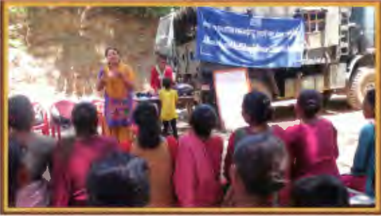
काभ्रेमा सामुहिक मनोविमर्श सचेतना कार्यक्रम